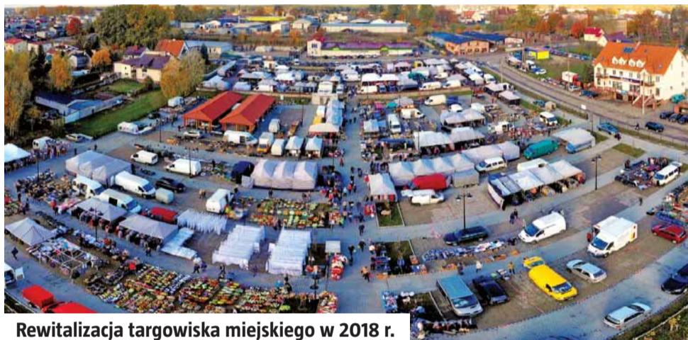
Rewitalizacja targowiska miejskiego w 2018 r.