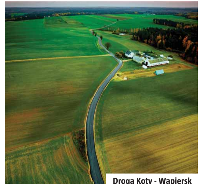
Droga Koty - Wąpiersk

Dużo się działo. Dziękuję wszystkim współpracownikom, z którymi buduję nasze miasto i gminę. Dziękuję Mieszkańcom za pomysły, a jeszcze bardziej za konstruktywną krytykę. Cieszę się, że obrona 5 lat temu droga, po której kroczyć wspólnie z Wami przynosi widoczne rezultaty.