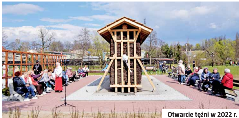
Otwarcie tężni w 2022 r.