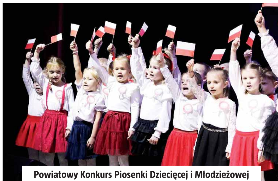
Powiatowy Konkurs Piosenki Dziecięcej i Młodzieżowej

W roku 105-lecia odzyskania niepodległości przez Rzeczpospolitą w sposób szczególny pamiętamy o naszej historii. To dzień, w którym marzenie pokoleń Polaków o własnym, niepodległym państwie stało