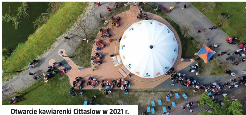
Otwarcie kawiarenki Cittaslow w 2021 r.