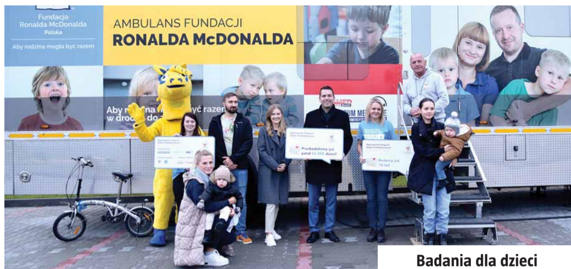
Badania dla dzieci

Końcówka roku to dobry moment na sprawdzenie swojego stanu zdrowia. Tym razem po raz kolejny postanowiliśmy zadbać o najmłodszych mieszkańców, i po raz pierwszy – o panów po trzydziestce.