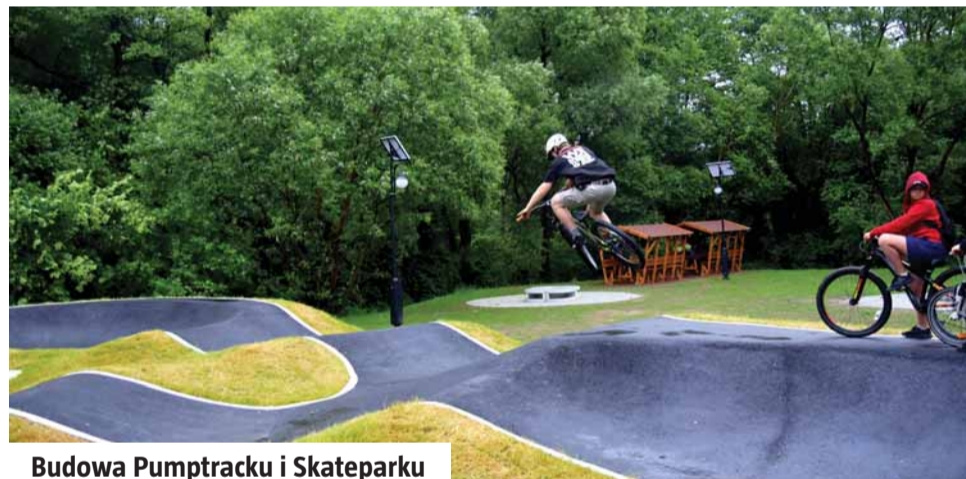
Budowa Pumptracku i Skateparku