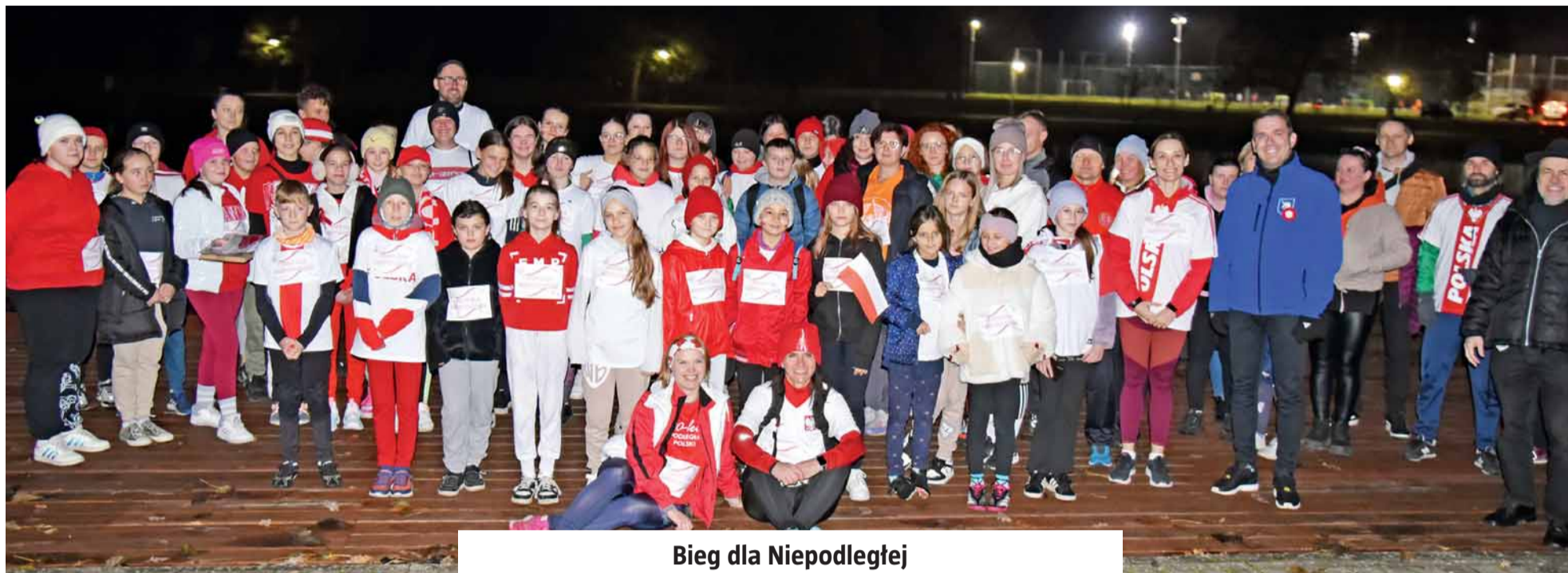
Bieg dla Niepodległej