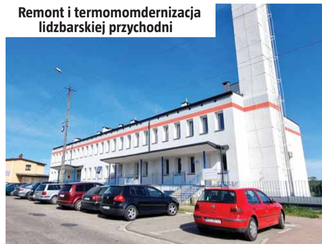
Remont i termomodernizacja lidzbarskiej przychodni