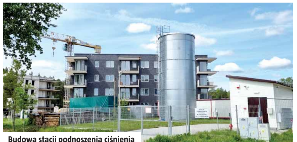
Budowa stacji podnoszenia ciśnienia