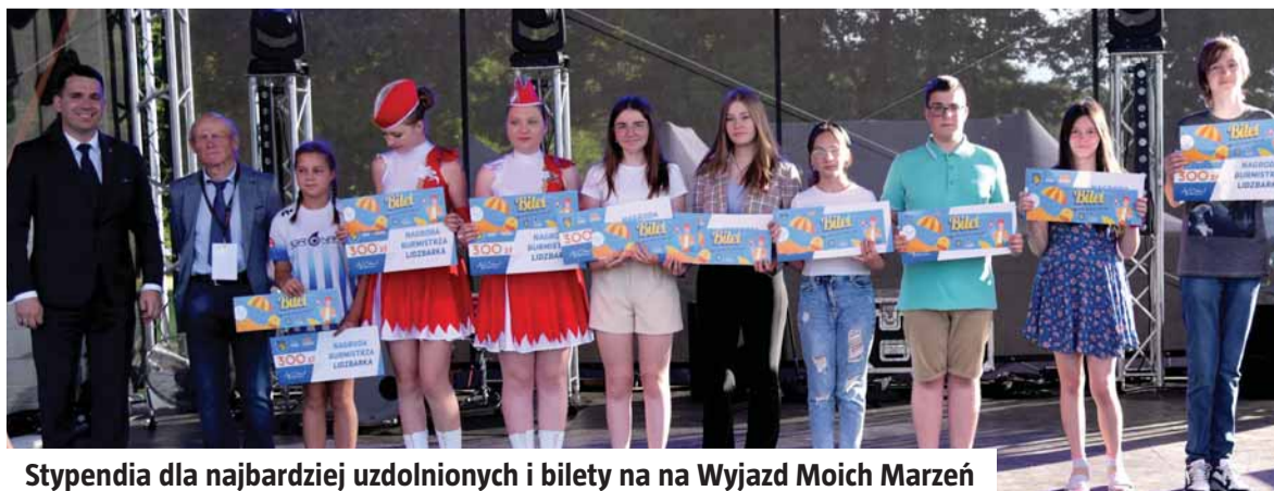
Stypendia dla najbardziej uzdolnionych i bilety na Wyjazd Moich Marzeń