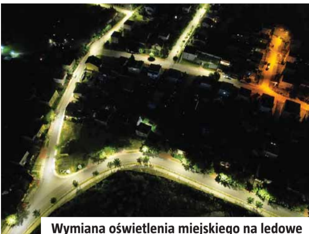
Wymiana oświetlenia miejskiego na ledowe