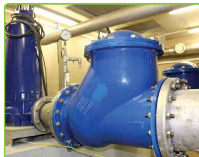
KONIEC Z PROBLEMEM LIDZBARSKICH PRZEPOMPOWNI