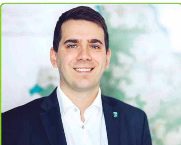
TO BYŁO OWOCNE 5 LAT...