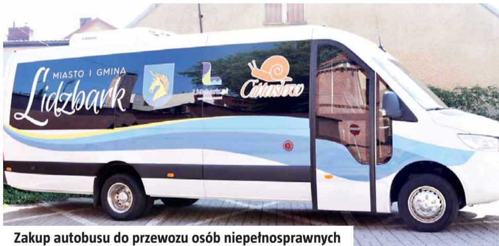
Zakup autobusu do przewozu osób niepełnosprawnych