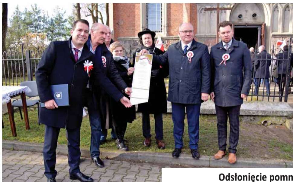
Odświeżenie pomnika w Dłutowie