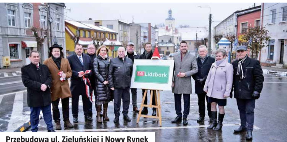
Przebudowa ul. Zieluńskiej i Nowy Rynek