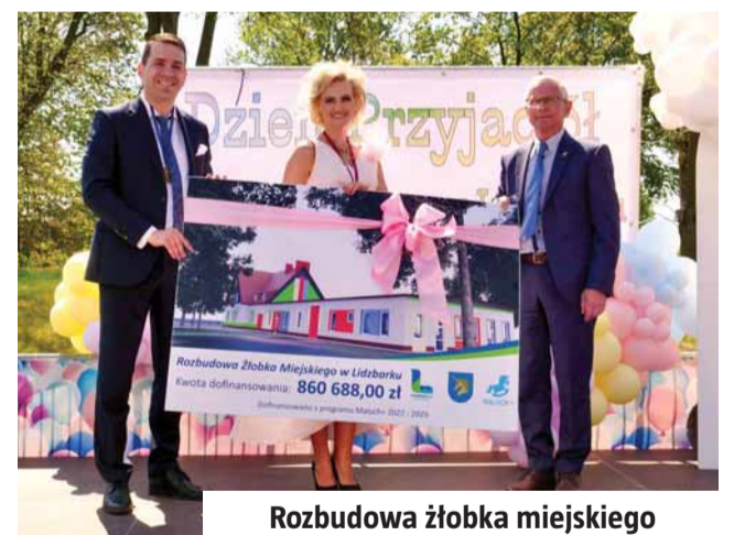
Rozbudowa żłobka miejskiego