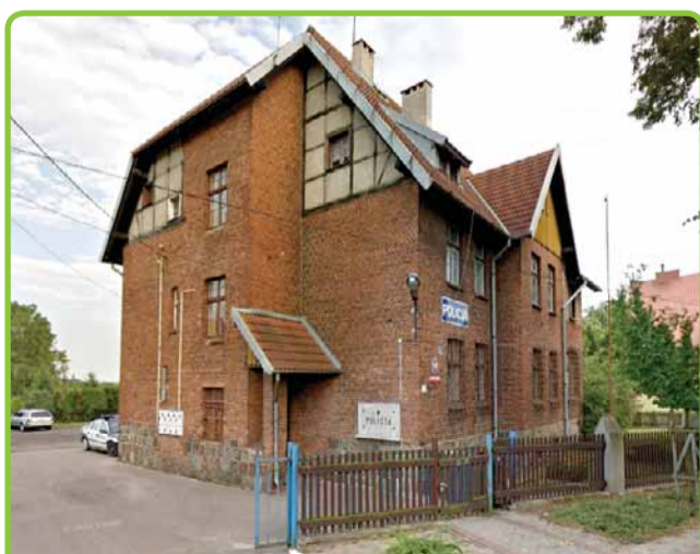
NOWY KOMISARIAT POLICJI JUŻ WKRÓTCE