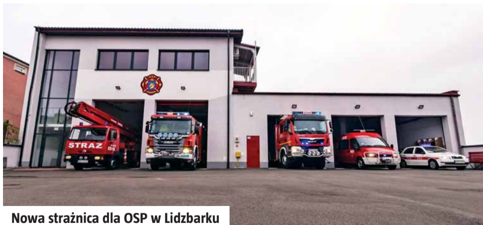
Nowa strażnica dla OSP w Lidzbarku