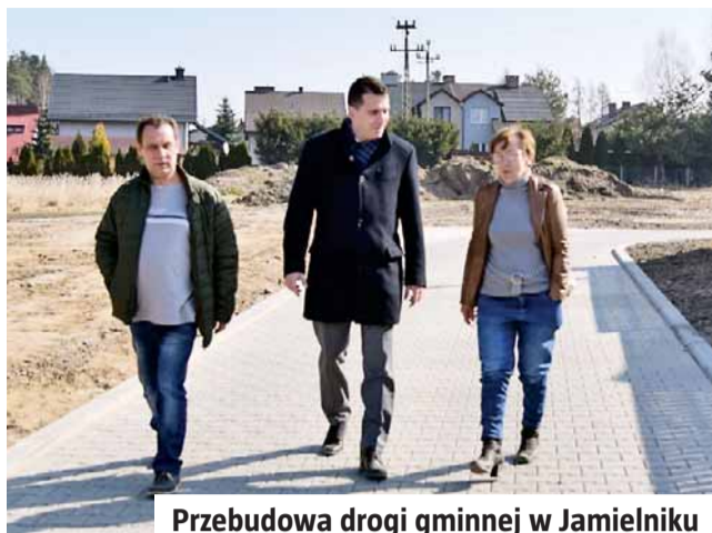
Przebudowa drogi gminnej w Jamielniku